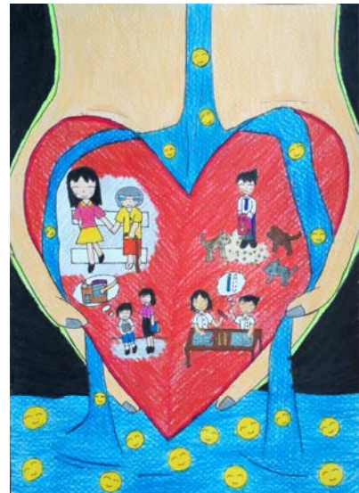
4. ด.ญ. ธันัญญา บุญทับถม ชั้น ป.6 โรงเรียนโกวิทอรัณ เขตราชเทวี กรุงเทพมหานคร