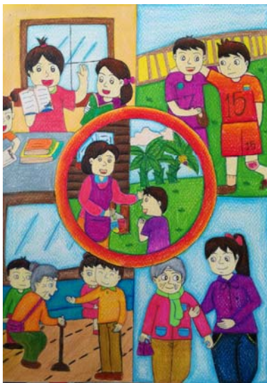
5. ด.ญ. วนิดา รูปเหลี่ยม ชั้น ม.1 โรงเรียนหนองแขวงบึงงาม อ.หนองพอก จ.ร้อยเอ็ด