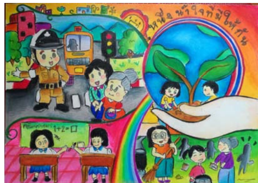
5. ด.ญ. อทิตยา ลุนลาน ชั้น ม.2 โรงเรียนปิยะมหาราชาลัย อ.เมือง จ.นครพนม