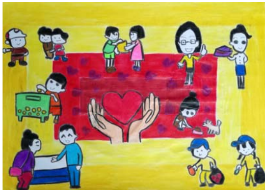
3. ด.ญ. ณิชมน คำหมู่ ชั้น ป.5 โรงเรียนโกวิทอรัณ เขตราชเทวี กรุงเทพมหานคร