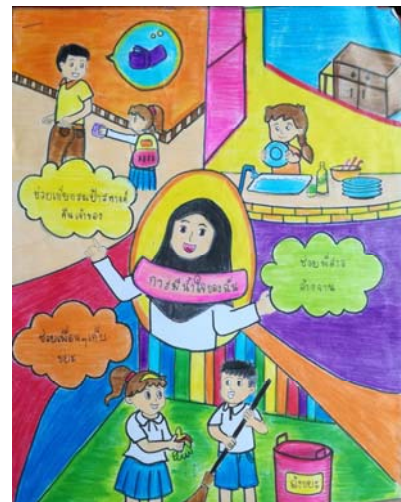
6. ด.ญ. ชุพียา มะลี ชั้น ม.2 โรงเรียนราชประชานุเคราะห์ 41 จ.ยะลา อ.รามัน จ.ยะลา