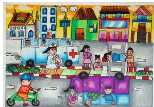
2. ด.ญ. ปาริฉัตร ผาสุข ชั้น ป.4 โรงเรียนวัดบางปลา (สมุทรวันราษฎร์บำรุง) อ.เมือง จ.สมุทรสาคร