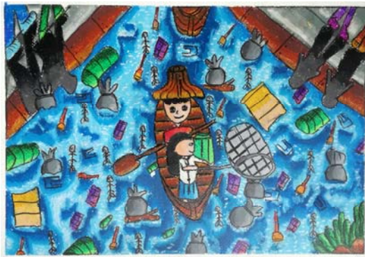
1. ด.ช. นครินทร์ นาก้อนทอง ชั้น ป.4 โรงเรียนวัดบางปลา (สมุทรวันราษฎร์บำรุง) อ.เมือง จ.สมุทรสาคร