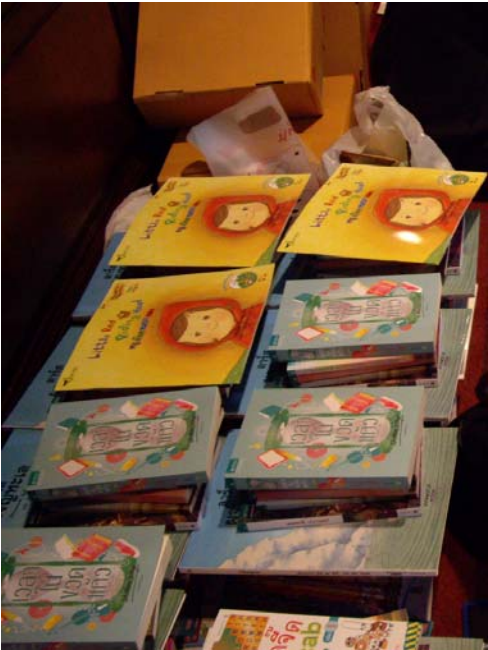
จัดซื้อหนังสือในงานสัปดาห์หนังสือแห่งชาติ เพื่อส่งให้โรงเรียนที่ส่งผลงานเข้าร่วมประกวด