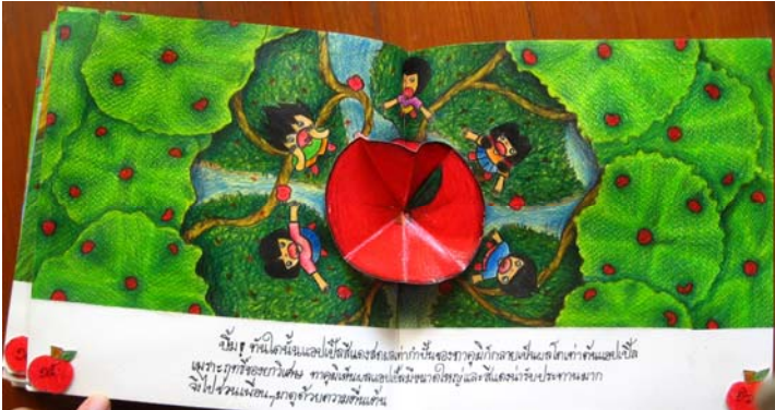
หลากหลายผลงาน